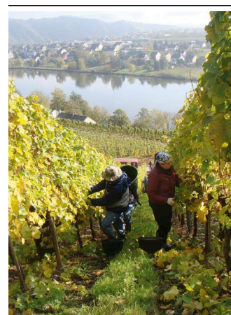
Vendanges sur les coteaux de la Moselle

Les vendanges du Riesling ont elles démarré fin septembre/début octobre.