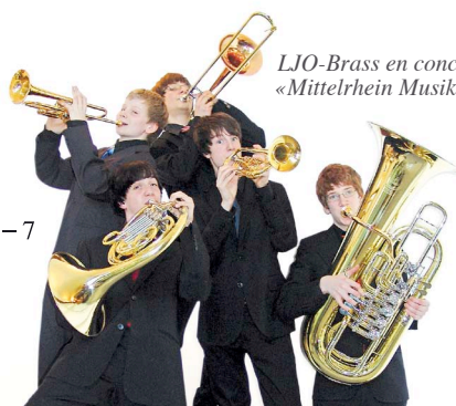
LJO-Brass en concert aux «Mittelrhein Musik Momente»