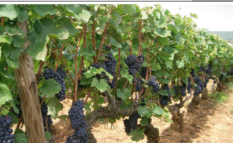
Vignoble pinot noir typique

En termes de qualité, le Pinot Noir incarne pour les vins rouges ce que le Riesling représente parmi les vins blancs: des vins destinés aux goûts raffinés.